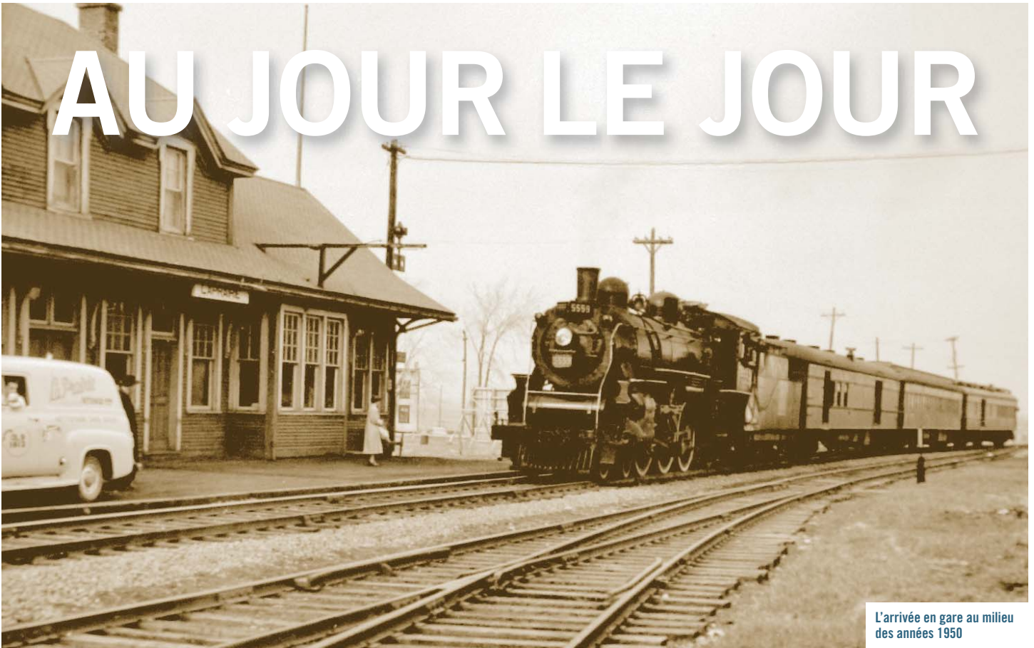
L'arrivée en gare au milieu des années 1950

Bulletin de la Société d'histoire de La-Prairie-de-la-Magdeleine