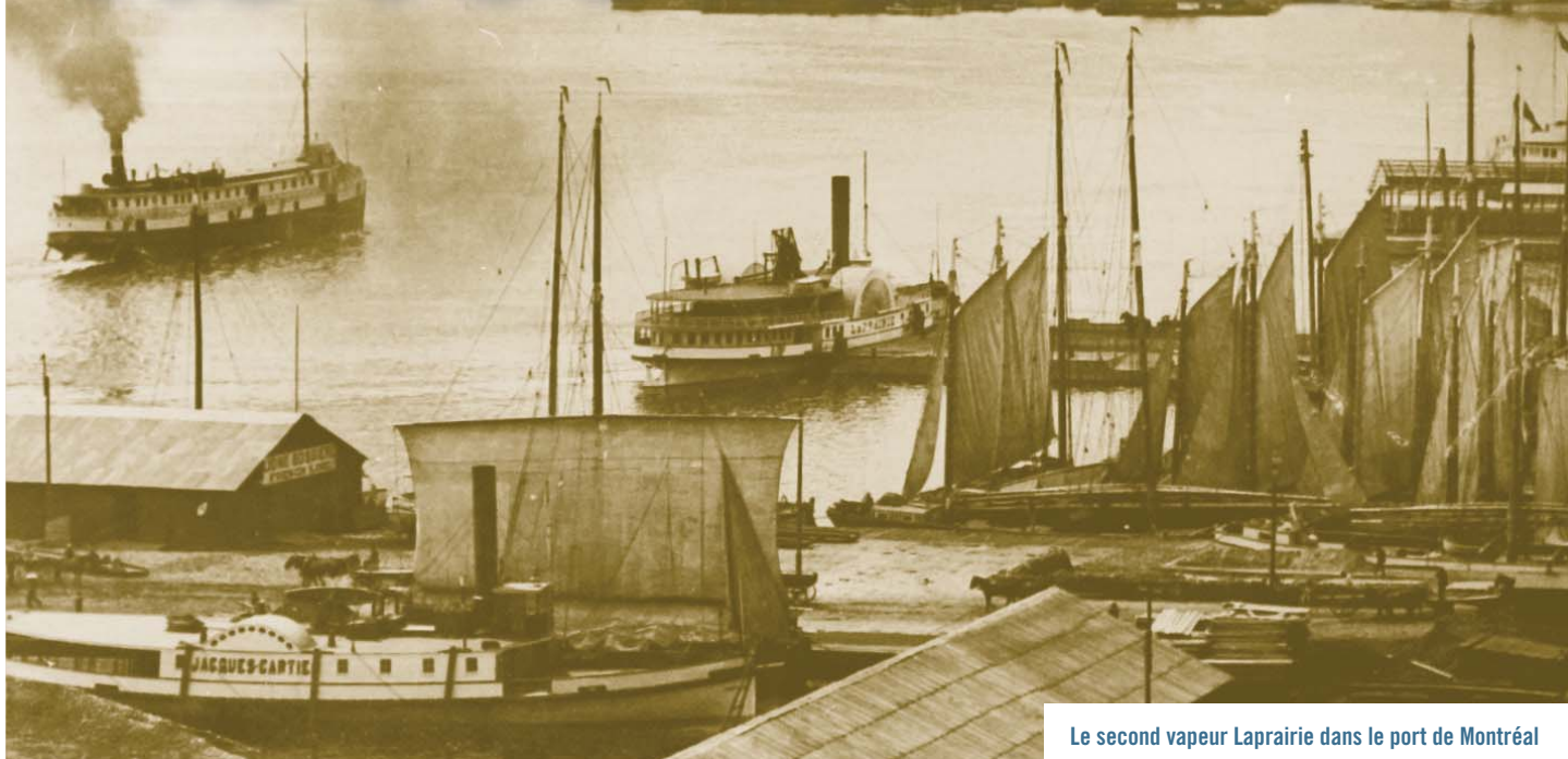
Le second vapeur Laprairie dans le port de Montréal

Bulletin de la Société d'histoire de La Prairie-de-la-Magdeleine