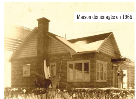
Maison déménagée en 1966