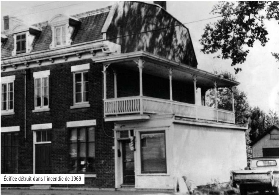
Édifice détruit dans l'incendie de 1969

Soucieux de bien loger sa jeune famille, M. Lupien avait, en février 1966, acheté pour 500,00 $, une solide maison qui devait être détruite pour permettre la construction de voies d'accès au pont Champlain. Le transport de la maison, l'excavation et les fondations coûtèrent au total 2 200,00 $ au nouveau propriétaire. Après l'avoir séparée de son garage, la maison fut transportée par M. Potvin via l'autoroute 132 et la rue Saint-Henri pour être installée au 581, rue Saint-Paul. Cet emplacement était le seul disponible dans le périmètre de ce qui fut durant plusieurs décennies un ancien cimetière protestant. Est-il utile de préciser que le docteur Lavallée s'était assuré de faire exhumer tous les restes humains avant qu'on y construise des maisons.