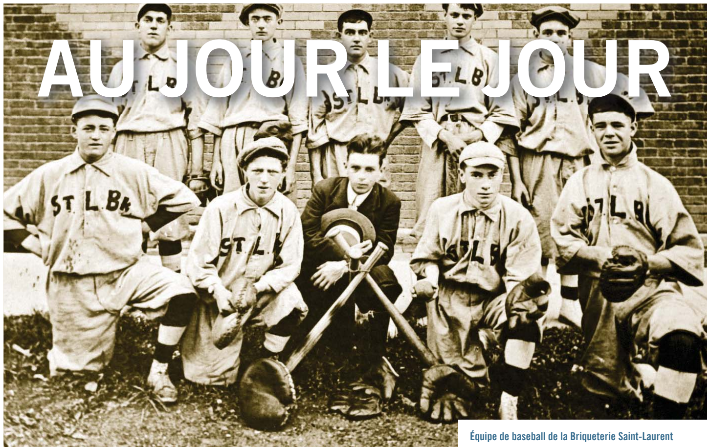
Équipe de baseball de la Briqueterie Saint-Laurent