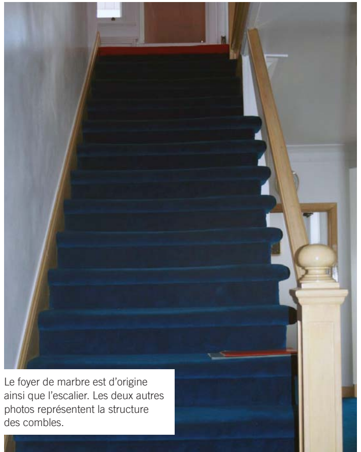
Le foyer de marbre est d'origine ainsi que l'escalier. Les deux autres photos représentent la structure des combles.

Il y a fort à parier que l'adoption du nouveau règlement 1344-M, fondée sur les recommandations du macro-inventaire dressé par l'architecte Michel Létourneau, a dû être influencée par l'attitude positive de la ville de Candiac face aux menaces qui pesaient sur la maison Page située au 32, boulevard Marie-Victorin. Un bel exemple à suivre.